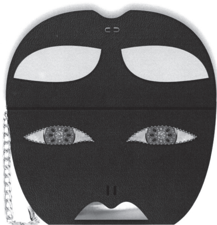
Vue de face, ouvert.